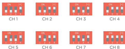
DIP switch settings